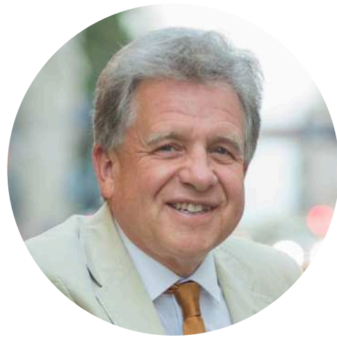
Fundador y Director Ejecutivo