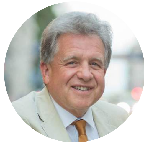
Gründer & Geschäftsführer